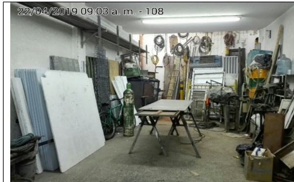
Fotografía N°3. Interior del establecimiento.