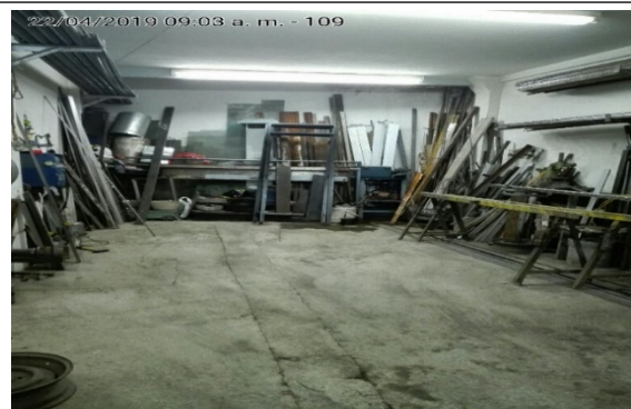
Fotografía N°4. Interior del establecimiento.